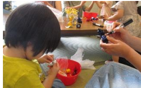
公民館手作りおもちゃ